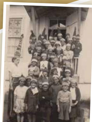
Élèves et professeur Première école de Lanthier (aujourd'hui 1 025, boulevard Rolland-Cloutier)

Vous avez des vêtements d'époque à la maison ? N'hésitez pas à les porter lors des évènements !