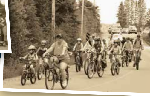
Parade de vélo 2014