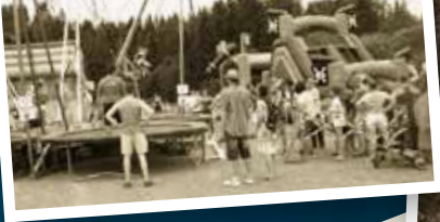
Fête du village 2015